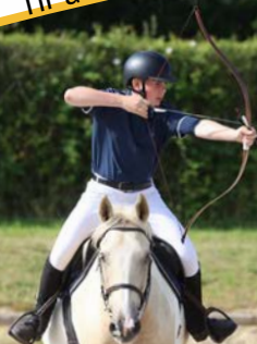
Tir à l'arc à cheval

Le tir à l'arc à cheval est la réunion de deux disciplines sportives traditionnelles : l'équitation et le tir à l'arc. La combinaison de ces deux sports provient de traditions asiatiques. L'objectif est de tirer dans un temps déterminé des flèches en mouvement dans une ou plusieurs cibles en ligne droite ou sur un parcours de chasse vallonné, sur une piste encadrée. L'esthétisme du geste et la difficulté d'allier vitesse et précision en font tout le charme.